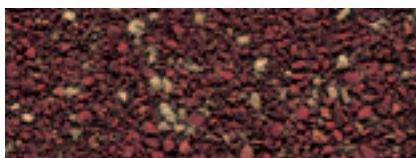
Rosso Mattone 45