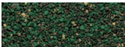
Verde Lichene 64