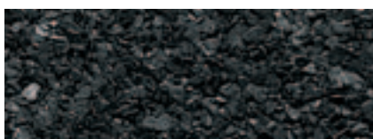
Grigio Ardesia 30