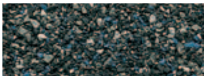
Grigio Granito 33