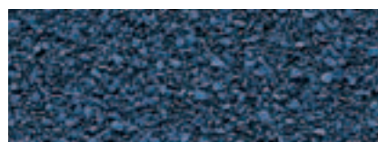
Blu Azzurrite 58