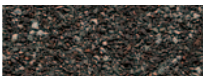
Grigio Pietra 34