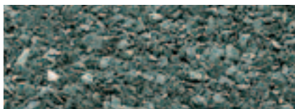
Grigio Chiaro 1