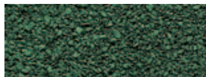
Verde Malachite 53